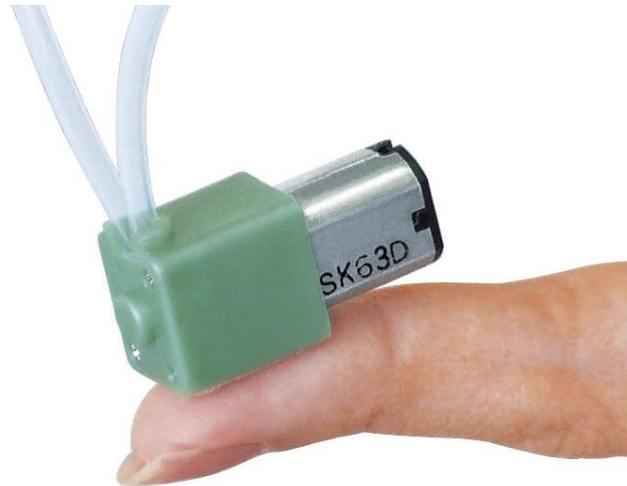
指尖大小的蠕动泵